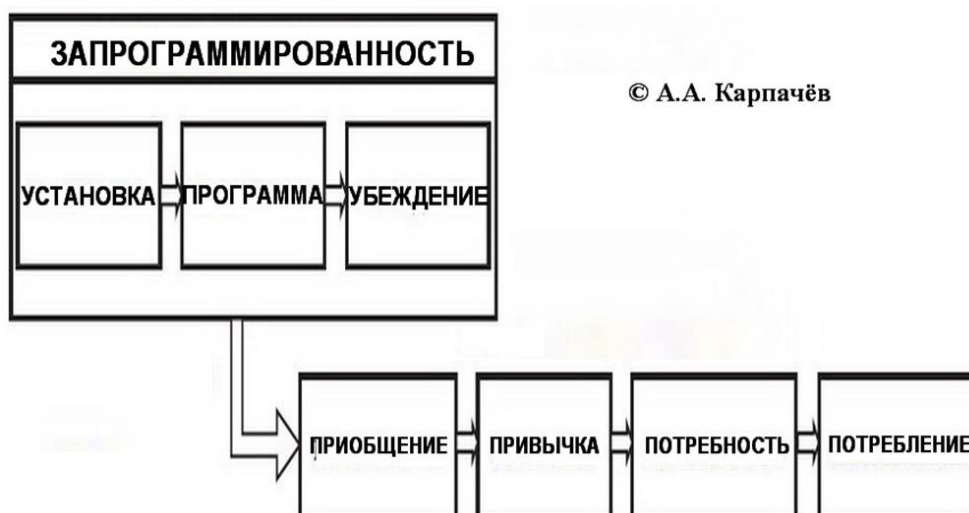
Рис.1. Социально-психологическое программирование.

Алгоритм социально-психологического программирования и формирования привычек и потребностей, разработанный на основе метода Г.А. Шичко, показан на Рис. 1.