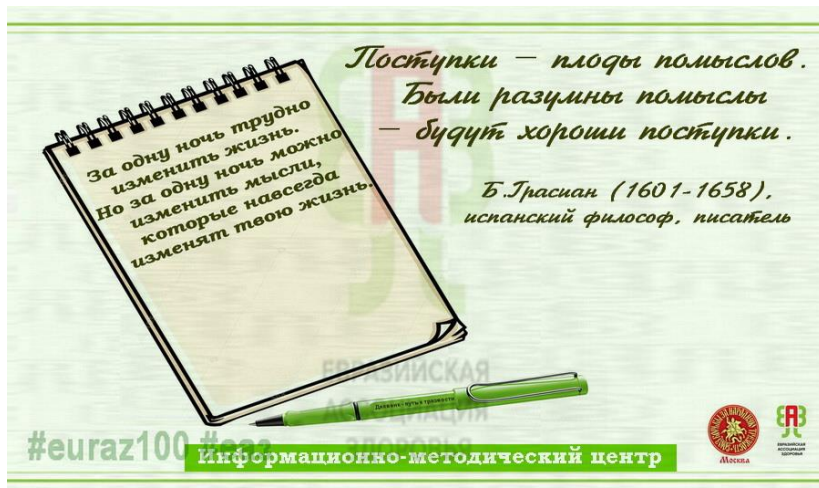
Рис.2. О дневнике

Написать: «Дневник нейтрализации проалкогольной запрограммированности и формирования трезвых убеждений» перед сном, соблюдая « Правила ведения Дневника » (форма 1)