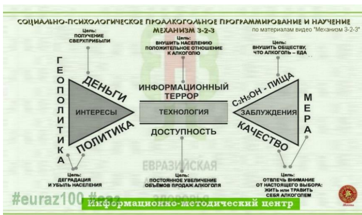
Рис. 3. Социально-психологическое проалкогольное программирование и научение.