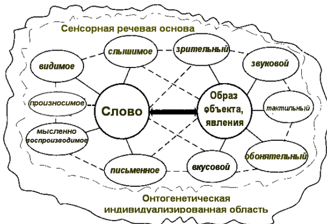
Рис. 5. Схема энграммы слова.

многочисленными взаимосвязями, закрепляется, приобретает черты целостности, становясь сенсорно речевой основой нового сложного и важного функционального образования — названного Павловым энграммой слова . Схема энграммы слова представлена на Рис. 5.