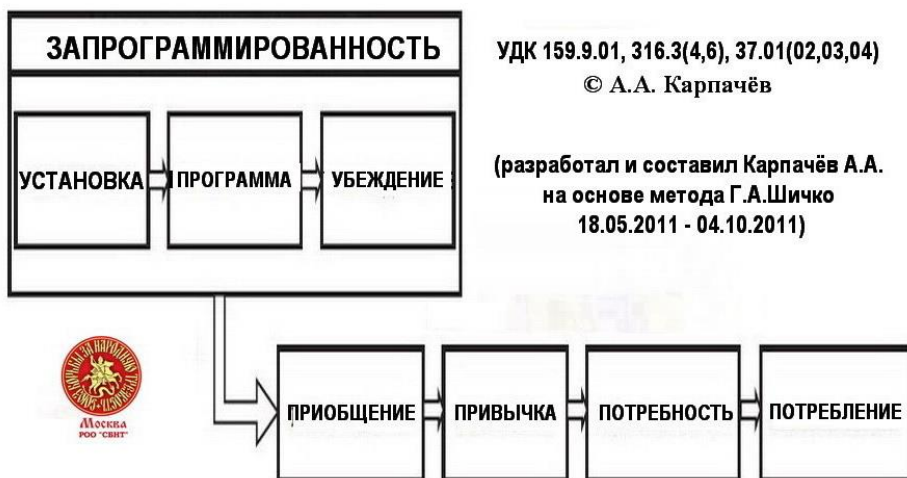
Рис. 1. Социально-психологическое программирование.

и формирования привычек и потребностей, разработанный на основе метода Г. А. Шичко, показан на Рис. 1.