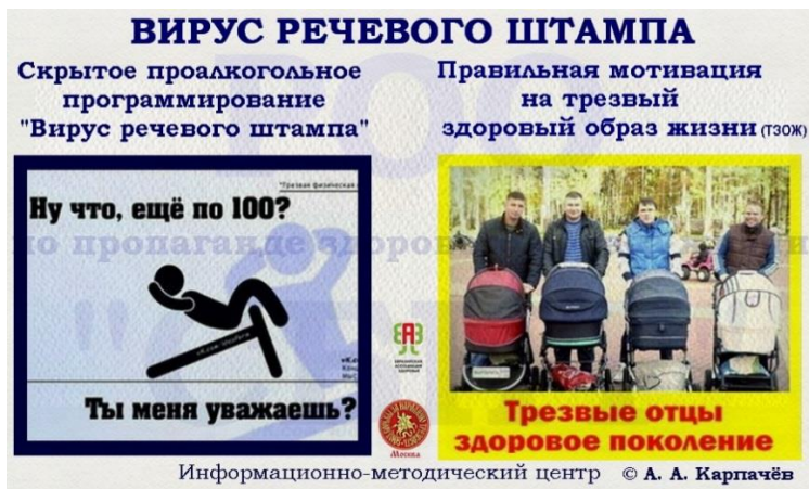
Рис. 7. Мотиватор «Вирус речевого штампа»

На рис. 7 слева («Ну что, ещё...?») продолжается «скрытое» социально-психологическое научение на проалкогольное поведение, потому что возникают проалкогольные ассоциации под действием слов (Ну что, ещё по 100? Ты меня уважаешь?) — проалкогольного «вируса речевого штампа». Иллюстрация здорового образа жизни (ЗОЖ) в данном мотиваторе мало действует на изменение сознания, а тем более подсознания.